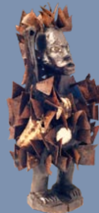
Estatueta Nkisi Nkondi Contém um «medicamento» dentro da cavidade coberta com o espelho. Congo c. 1880- 1910 Madeira, metal, osso e espelho

No Porto, é possível visitar a excelente reconstituição da Farmácia Estácio, inaugurada em 1924, na rua Sá da Bandeira. Ficou célebre esta farmácia no final dos anos quarenta pela sua balança falante tornando-se um ex-libris da baixa portuense dessa época.